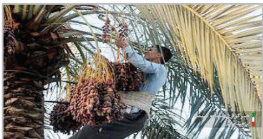
برداشت محصول خرما - خوزستان