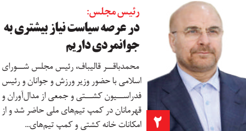
رئیس مجلس: در عرصه سیاست نیاز بیشتری به جوانمردی داریم

کسانی که با ماشین‌های آخرین مدل، با دل سیر از وعده غذایی که خوردند، با لباس‌های تمیز و گران قیمت و با دوربین‌های روشن، کنار کودک کار می‌ایستند و جز به جزء فلاکت او را روایت می‌کنند تا در نهایت نشان بدهند که سخاوتمندانه قرار است برای او غذا یا لباسی تهیه کنند. همان نمونه‌هایی که در فضای مجازی در صفحه خبرها می‌بینیم که اگر نخواهیم کار آنها را به‌طور کامل میل به دیده شدن و خودنمایی تفسیر کنیم، بی‌شک از یک ناگامی و بی‌سوادی اجتماعی ناشی می‌شود. تازه اگر بخواهیم فیلم گرفتن از چهره کودک کار و پخش آن را نادیده بگیریم، این خیرترین موفقی که کارشان با کودکان کار در حد تولید یک ویدیوی چنددقیقه‌ای به پایان می‌رسد، نمی‌دانند که با این شیوه کمک کردن و روایت شرایط ناگوار و جلوی دوربین قرار دادنشان، آنها را بیشتر از این چیزی که هست، زخمی و آسیب‌خورده می‌کند. اگر قرار است اقدام مفیدی برای کودکان کار شود، راه‌های متفاوت و اثرگذار بسیاری وجود دارد.