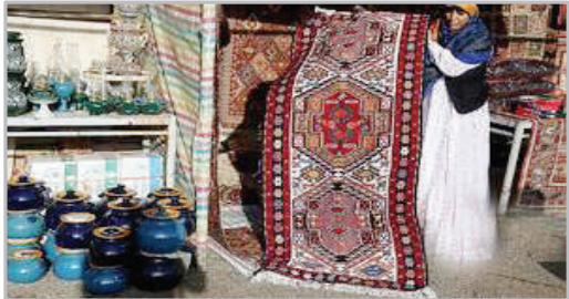
اهر، شهر ملی ورنی