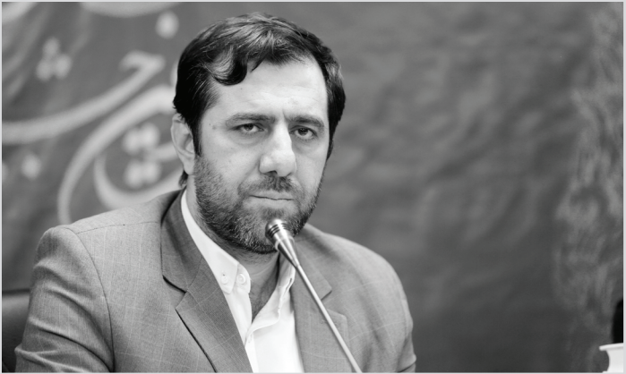
مدیرکل بنیاد مسکن استان فارس

حرفه‌ای‌ترین گروه‌های اجرا طی ۱۰ شب به اجرای زندگی‌نامه حافظ شیرازی در قالب نور، تصویر و صوت می‌پردازند و تلاش خواهیم کرد این اثر یک کار ویژه باشد.