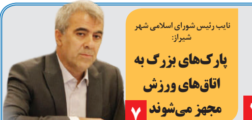
نایب رئیس شورای اسلامی شهر شیراز: پارک‌های بزرگ به اتاق‌های ورزش مجهز می‌شوند