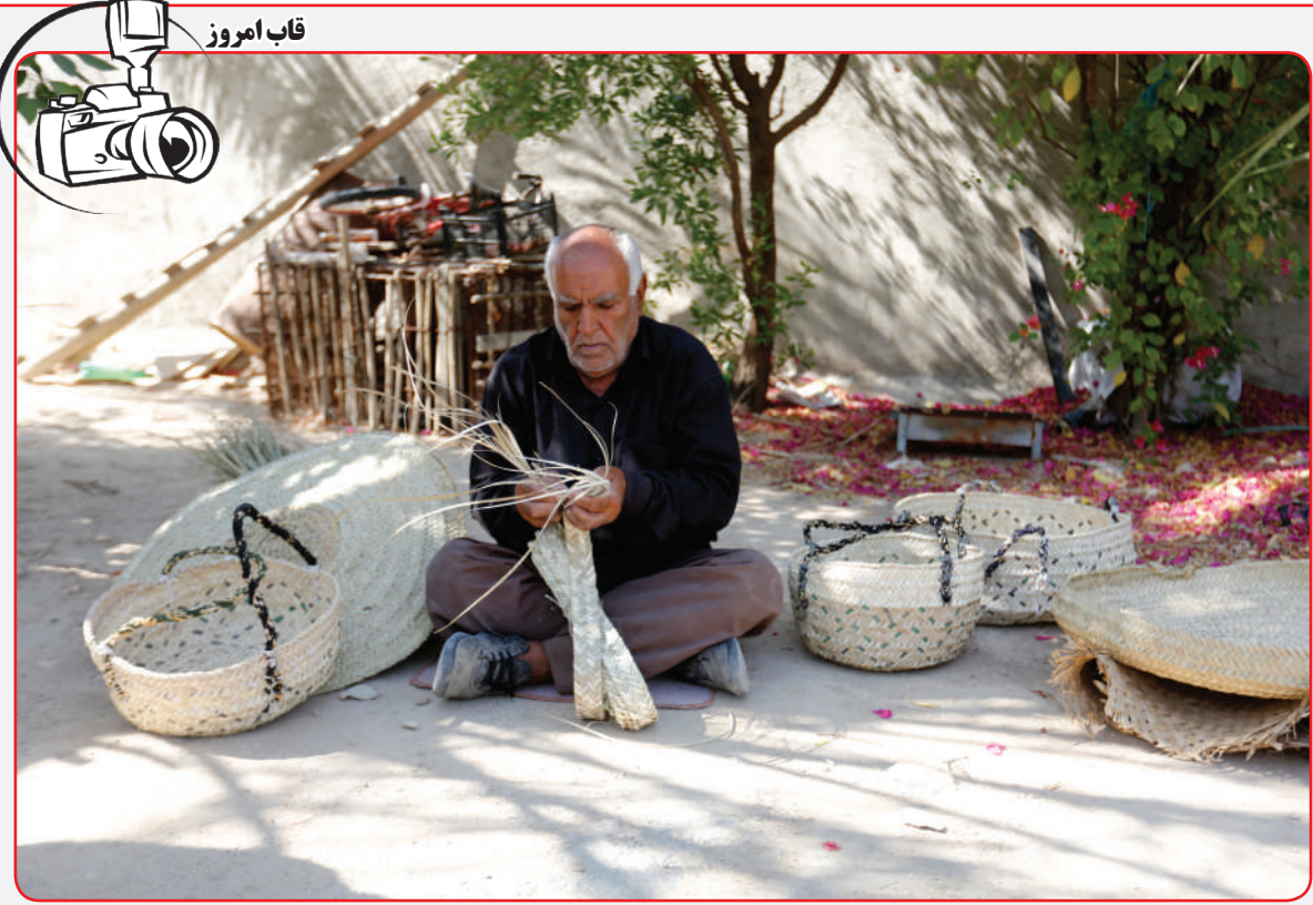
حصیر بافی در باغ‌داران نخلستان

عوامل فیزیولوژیکی نیز می‌تواند در بروز کابوس‌ها نقش داشته باشند. برای مثال، تب بالا