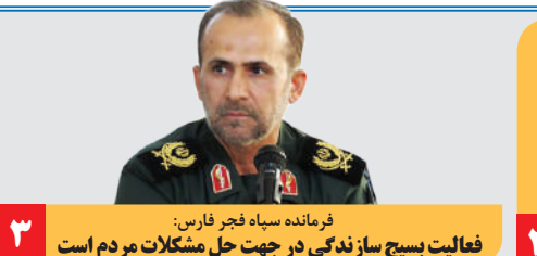
فرمانده سپاه فجر فارس: فعالیت بسج سازندگی در جهت حل مشکلات مردم است