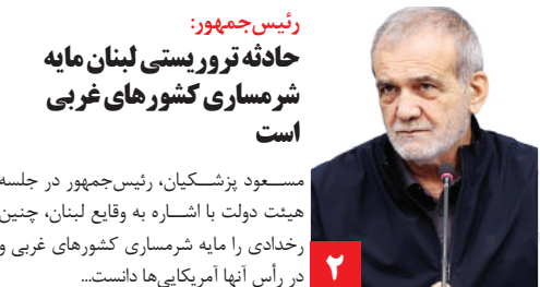
رئیس‌جمهور: حادثه تروریستی لبنان مایه شرمساری کشورهای غربی است