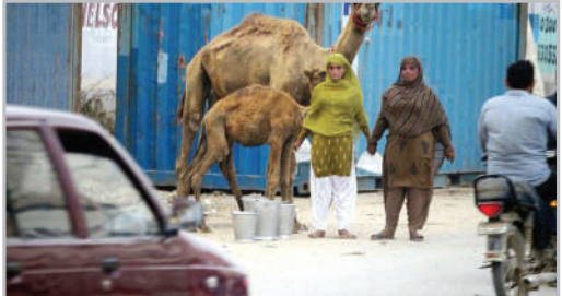
فروش شیر شتر در کنار جاده - لاهور پاکستان