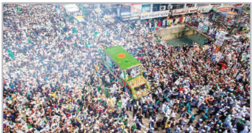
جشن میلاد پیامبر اسلام (ص) - بنگلادش