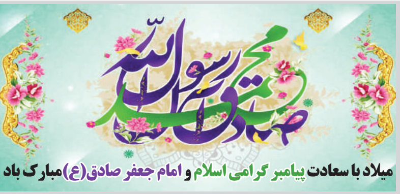
میلاد با سعادت پیامبر گرامی اسلام و امام جعفر صادق (ع) مبارک باد

تهیه مسکن به عنوان اولین نیاز هر خانواده است، اما تأمین سرپرده برای خانواده‌های ایرانی نزدیک به یک دهه است که به دلیل گرانی و رکود حاصل از گرانی