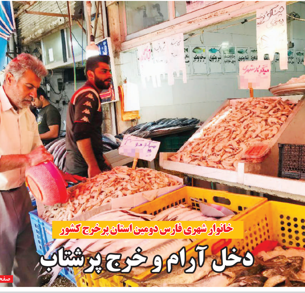
عکس: فاطمه حیدری