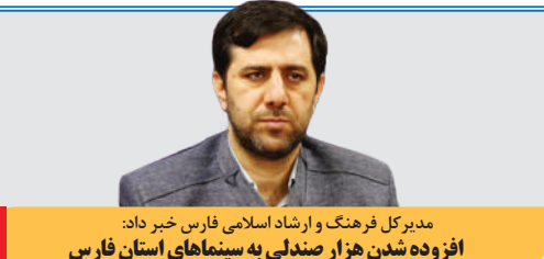
مدبرکل فرهنگ و ارشاد اسلامی فارس خیر داد: افزوده شدن هزار صندلی به سینماهای استان فارس