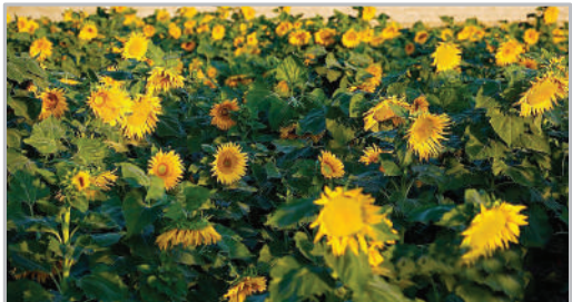
مزارع گل آفتابگردان - ابرکوه